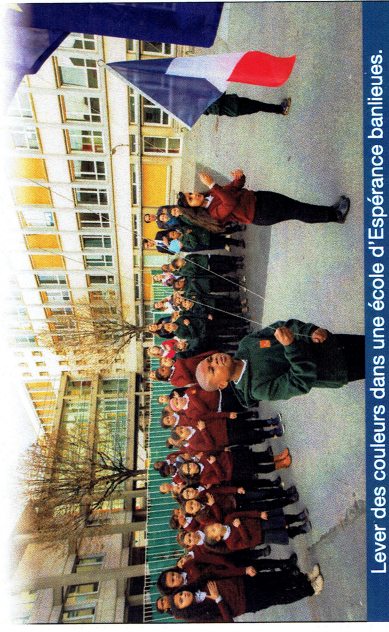
Lever des couleurs dans une école d'Espérance banlieues.

Le SECOURS DE FRANCE apporte également son aide aux initiatives privées visant à favoriser l'éducation et l'insertion, dès leur plus jeune âge, des enfants issus de milieux défavorisés.